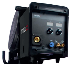
TitanFeed XHF 25 Панель управления