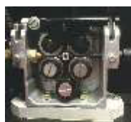
4-х роликовый механизм подачи