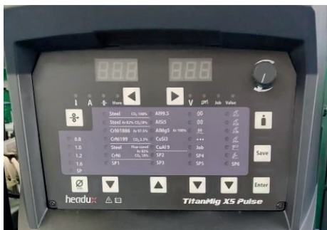
Панель управления TitanMig X4/X5 Pulse